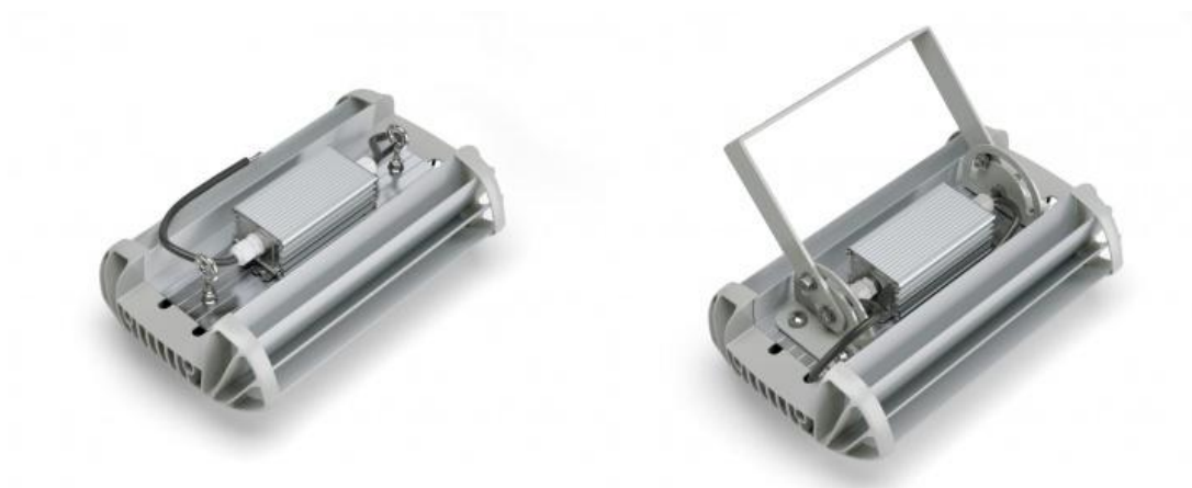
Рисунок 3. Варианты крепления – на винт-петлю и регулируемый кронштейн